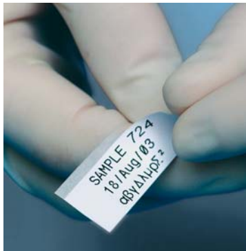
Exposed edge makes peeling easy—even with gloves.