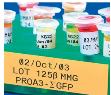
Specific laboratory symbols