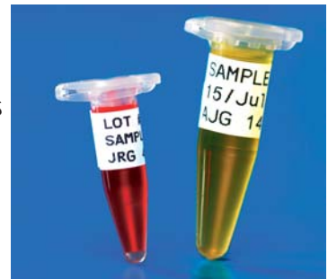
Pre-programmed vial ID sizes (0.6, 1.5 & 2 ml)