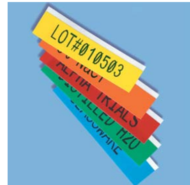
Colored tapes for general purpose labeling.